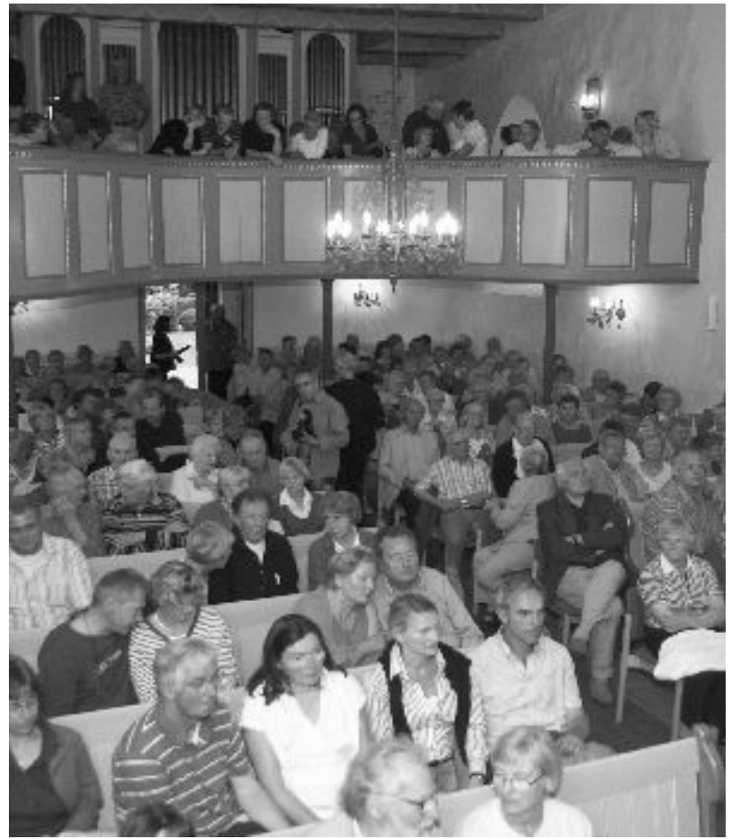
4. Juli 2009: Butter bei die Fische in Toestrup